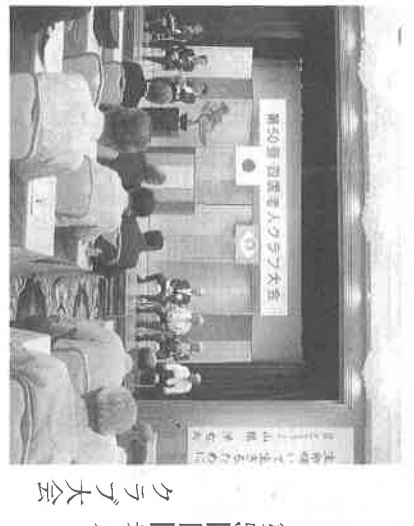
第50回四国老人 クラブ大会 平成20年8月7日