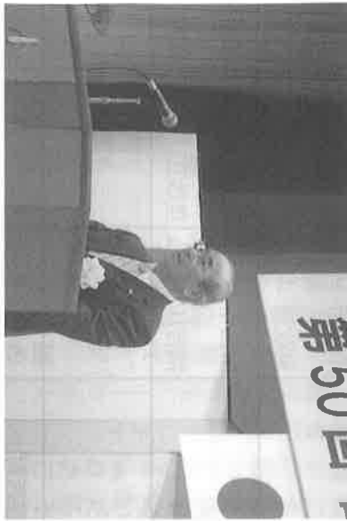
成川県老連会長 開会あいさつ

成川県老連会長のあ いさつに続き、老人ク ラブ活動に貢献されま した23名の方々が表彰 されました。