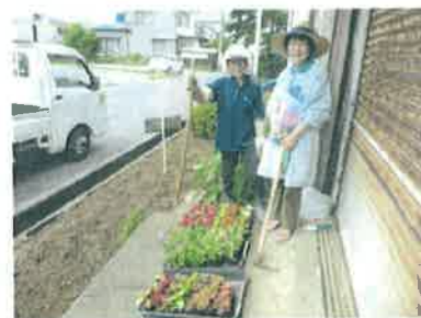
再度土を耕し、届いた花苗を前にして 2021/05/22 09:55

7月4週目頃～8月末までの水やりの当番表を作り7名の会員の方に、お願いする事にしました。