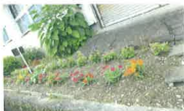
花植え後50日となりました