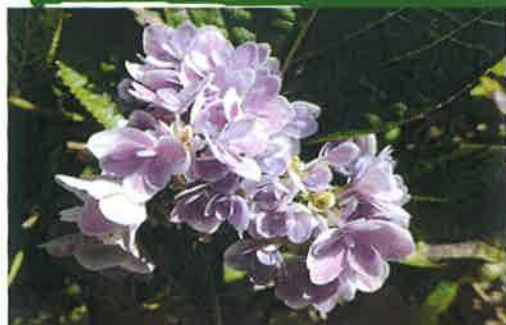
道端にひっそりと咲く花(戸波)