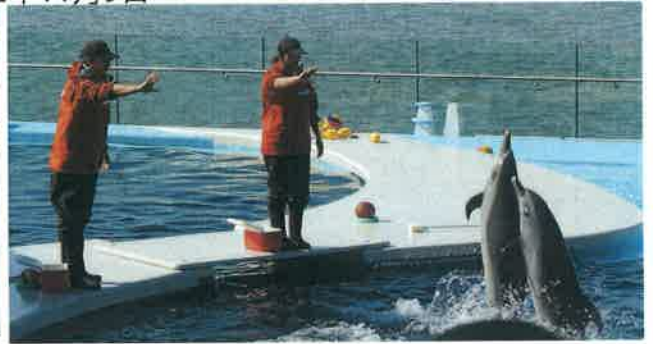
四国水族館～丸亀城～まんのう公園