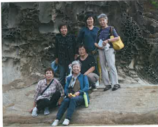
いずまゆうとぴあ 見ノ越海岸にて