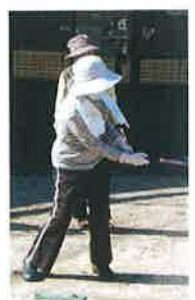
競技前の打合せ、スタートです。