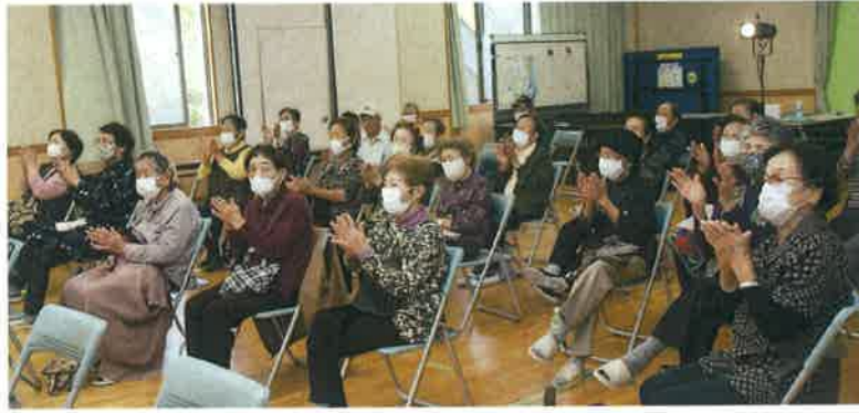
新居白寿会&新居永寿会の皆さん