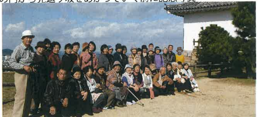
石垣の名城として全国的に有名な天守本丸前の広場にて