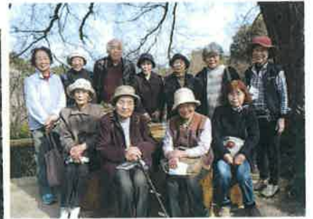
「牧野植物園ラン展」にて