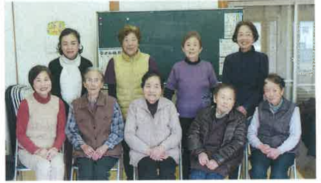
用石白寿会「毎週の百歳体操にて」