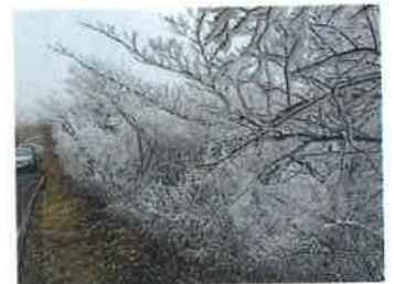
“樹氷” UFOラインにて 11月30日