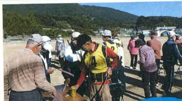
グラウンドゴルフ大会 11月6日 参加者26名