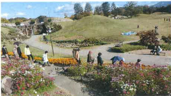
国営讃岐「まんのう公園」にて