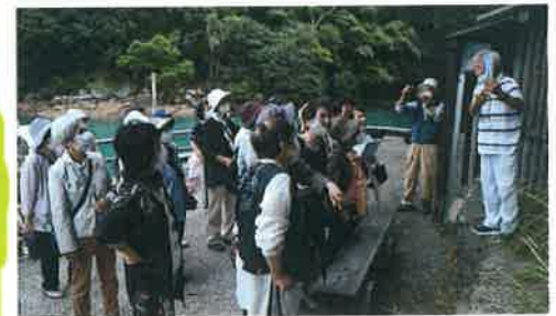
最後までゆっくりと楽しんだ有志! 見残し海岸での記念撮影

グラスボードに乗船し 途中「テーブルサンゴ」 を見学し見残し海岸へ上陸!! 海岸2km余をゆっくり と散策、最後まで頑張ったのは、参加者30名の内17 名の皆さんでした。頑張りましたね!