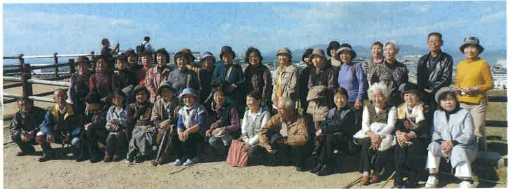
標高66mの亀山に築かれた「史跡丸亀城」(平山城)