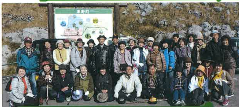
天狗高原ハイキング 10月31日 参加者33名