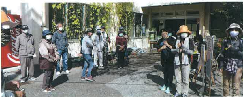
市民館の前に全員集合 世話役の案内で出発！