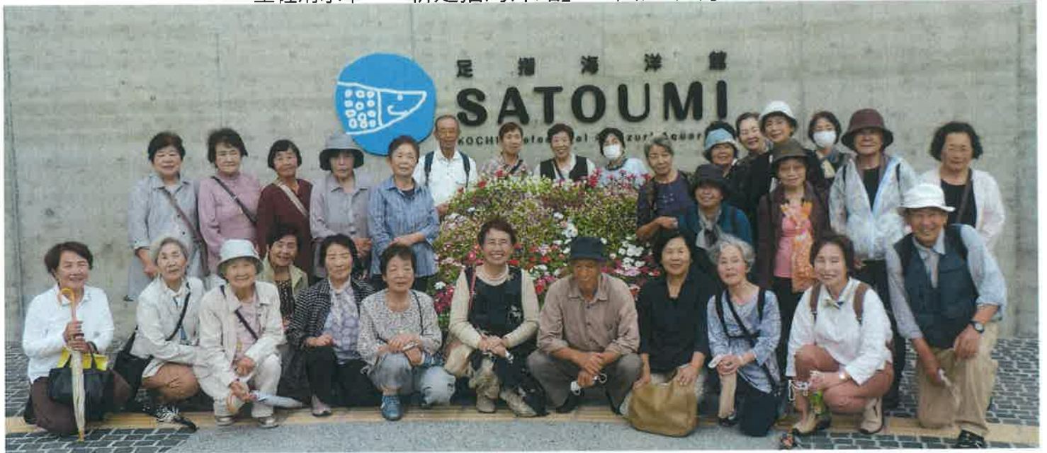
新しく7月18日オープンした「SATOUMI」新足摺海洋館