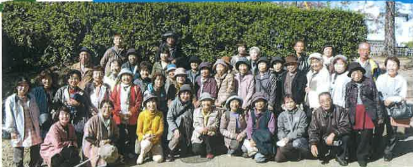
県外研修「四国水族館&丸亀城」 11月9日 参加者41名