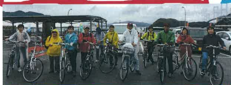
しまなみ海道サイクリング 10月17日 参加者12名