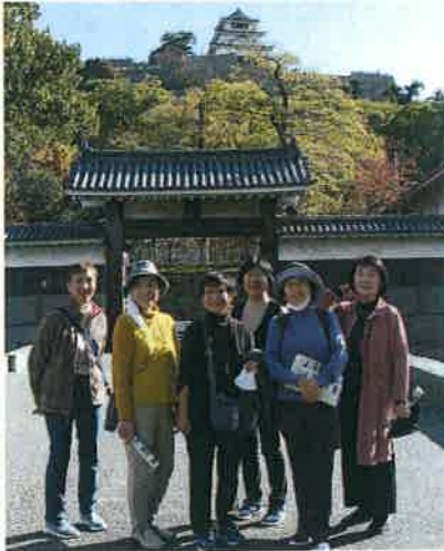
丸亀城にて記念写真を！ 丸亀城 (築城1660年)