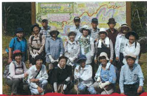
久保谷森林セラピーロード 8月8日 参加者19名