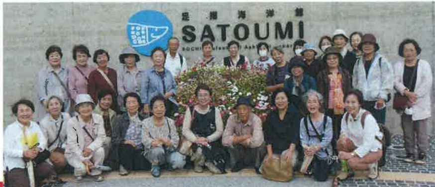
土佐清水市「足摺海洋館」 9月12日 参加者30名