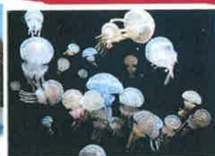
足摺海洋館「クラゲ」