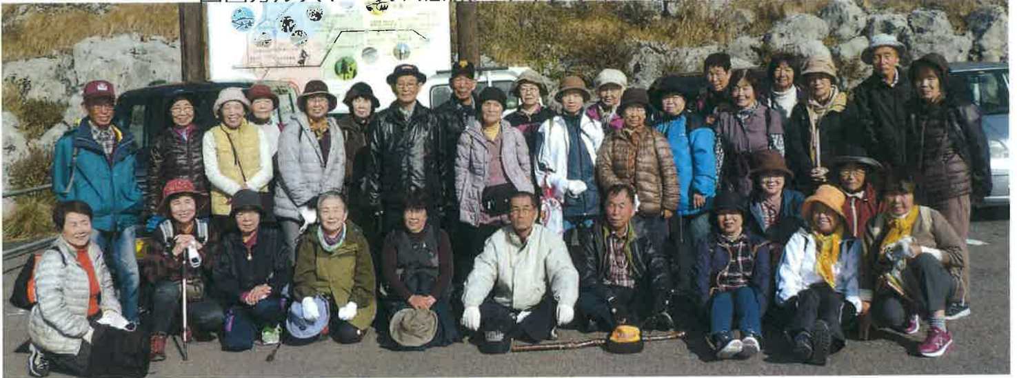
天狗高原駐車場に到着（土佐市出発午前7時～天狗高原到着9時30分）