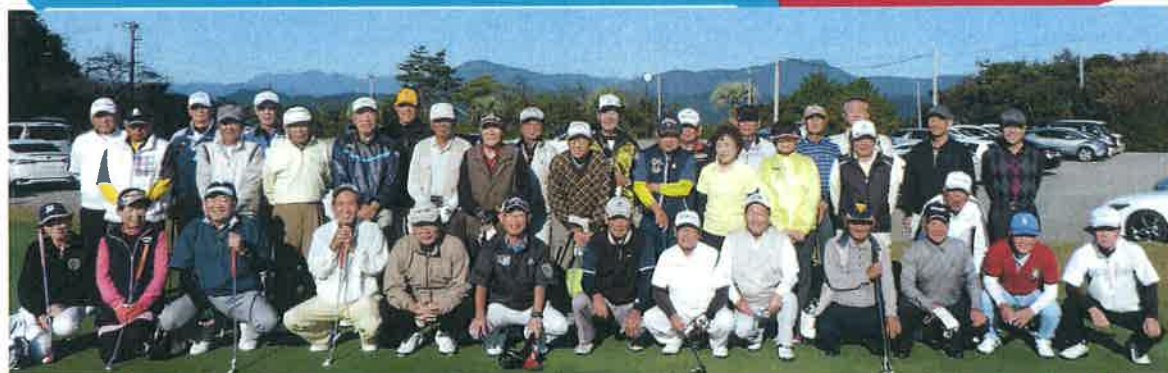
よさこいクラブ高知「シニアゴルフ大会」 10月20日 参加者37名