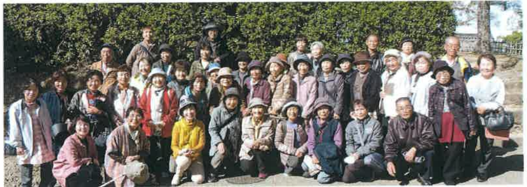
大手二の門から見返り坂をあがっていく前に記念写真