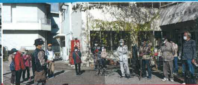
戸波地区健康ウォーキング 10月24日 参加者26名