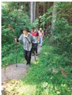
森林浴で心も身体もリフレッシュ!!