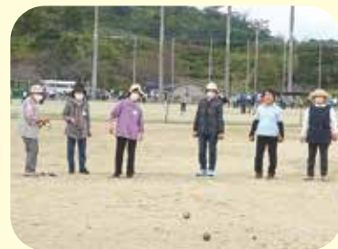
西部会場（ペタンク）