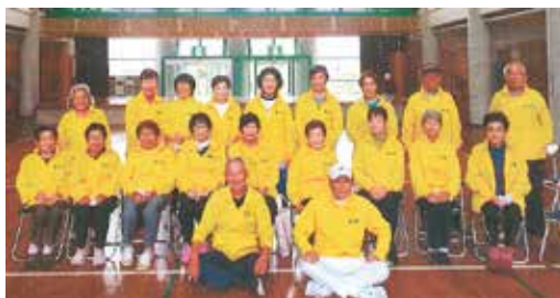
お揃いのジャケットを着て、明るく元気に活動しています。

クラブには軽スポーツ・レクリエーション、学習・研修部会、美化・清掃部会が設置されており、組織的にスムーズな運営がされています。