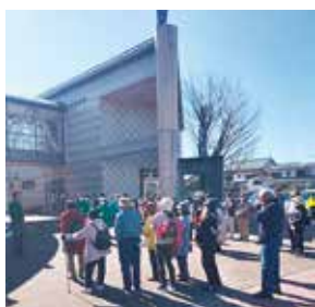
ウォーキング前の開会式

3月13日、会員パワーアップ研修会に参加し、田野町での「歴史探訪ウォーキング」や東洋町社協考案の「新聞紙体操」をみんなで体験しました。