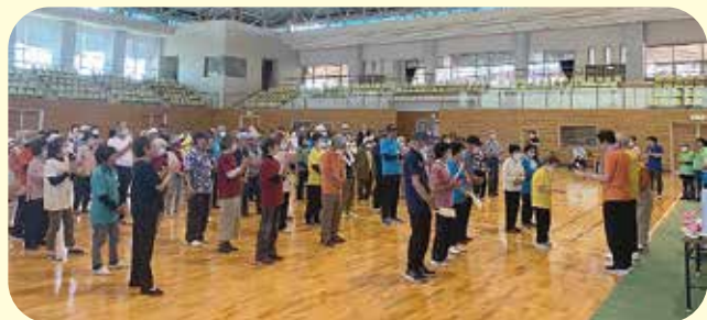
西部会場（室内競技）