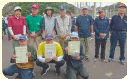
西部会場（グラウンド・ゴルフ）