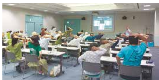
呼吸筋ストレッチ体操