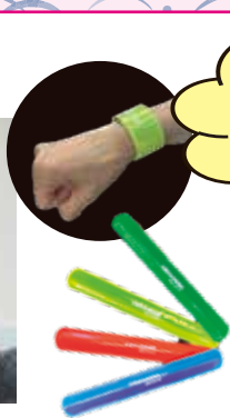
夜間歩行者用の 反射リストバンド

夜間の道路横断中の事故が多く発生しています。交通事故に遭わないよう活用してください。