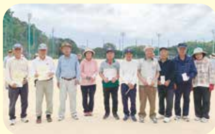
中部会場（グラウンド・ゴルフ）