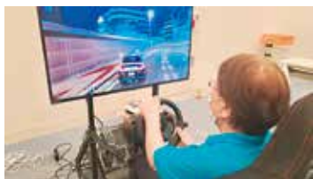
「グランツーリスモ」のカーレースを初体験

8月19日、関係機関の多くの方々が見守る中、会員・非会員合わせて31名が参加して、人気の高まっている「eスポーツ」の体験会を開催しました。