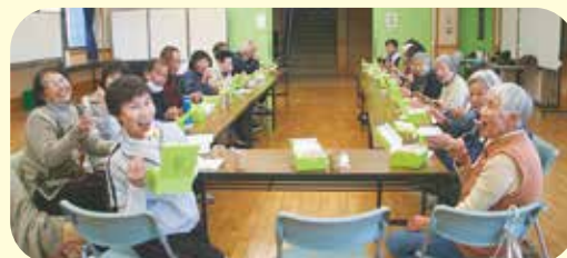
お楽しみのカフェタイム♪