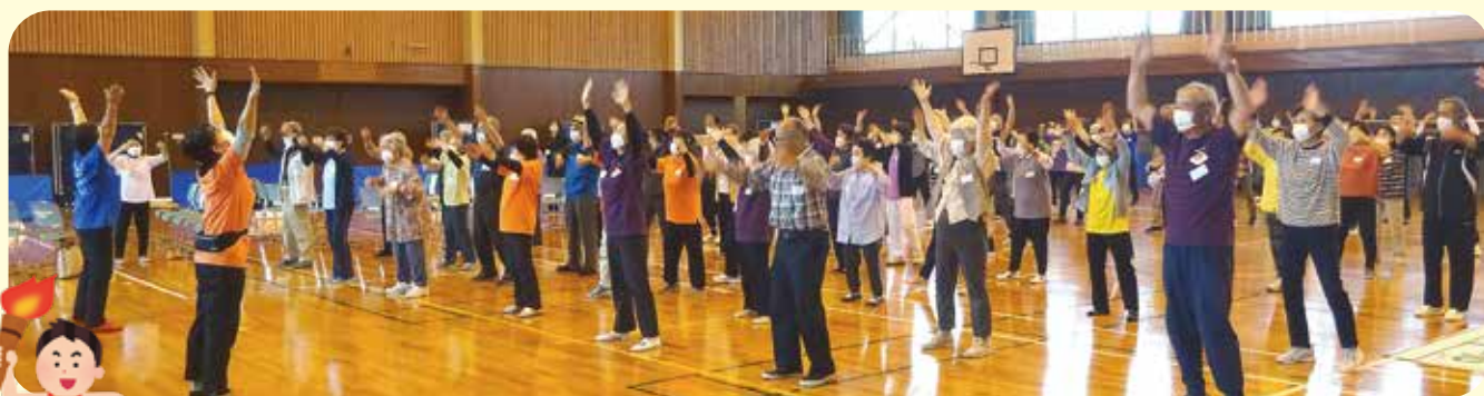
東部会場（室内競技）