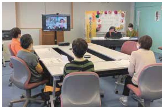
テレビ画面を見ながら、香川県の皆さんと情報交換