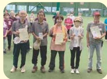
東部会場（モルック）