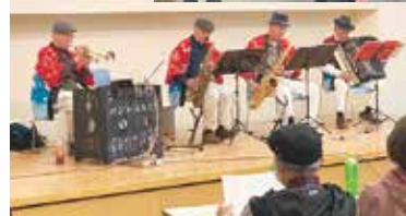
3月28日牧野公園ウォーキング&バンド演奏 (佐川町 54人参加)