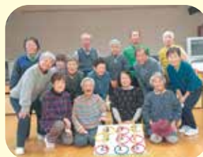
ワナゲ台を囲んでハイチーズ!

練習後にはカフェタイムをとったり、毎回ワナゲ入賞者に賞品を渡すなどの工夫も継続の秘訣となっています。