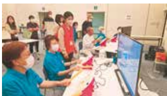
「太鼓の達人」をプレイする様子