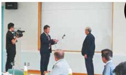
贈 呈 式