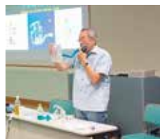
高知リハビリテーション 専門職大学長

加齢による呼吸機能の変化について説明があり、実際にペットボトルを使って呼吸筋を鍛える方法やストレッチ体操を行い、参加者は熱心に取り組んでいました。