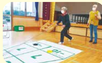
高得点目指して、シュート!