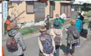
3月13日歴史探訪&東洋町新聞紙体操 (田野町 46人参加)