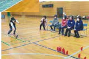
2月19日スクエアステップ&室内モルック (宿毛市 36人参加)