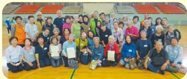
中部会場（室内競技）